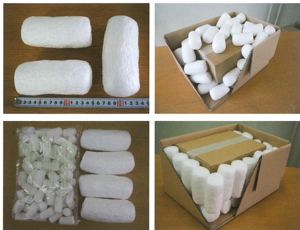
(200 個入り小袋との比較)